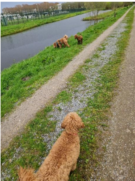
Heerlijk in het bos!

Vandaag hebben we de werpkist neergezet. Je gaat er gelijk inliggen als een prinses, en al je kluijjes en speeltjes worden er naartoe verhuisd. Wat heerlijk om je zo bezig te zien. Je vind het een fijn plekje.