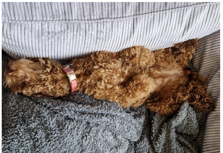
Ik lig met zeer grote regelmaat heerlijk te relaxen!