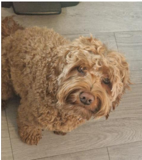
Wachten in de keuken tot er iets lekkers valt. Zo kennen ze mij niet!

Normaal gesproken zou je in deze fase van de dracht nog geen extra eten nodig hebben. Echter kiezen we er voor je liever gezonde voeding te geven ipv steeds een koekje. Ook gaan we de porties wat kleiner maken en deze wat vaker op een dag aanbieden. Hopelijk helpt dit om je grootste hongergevoel weg te halen.