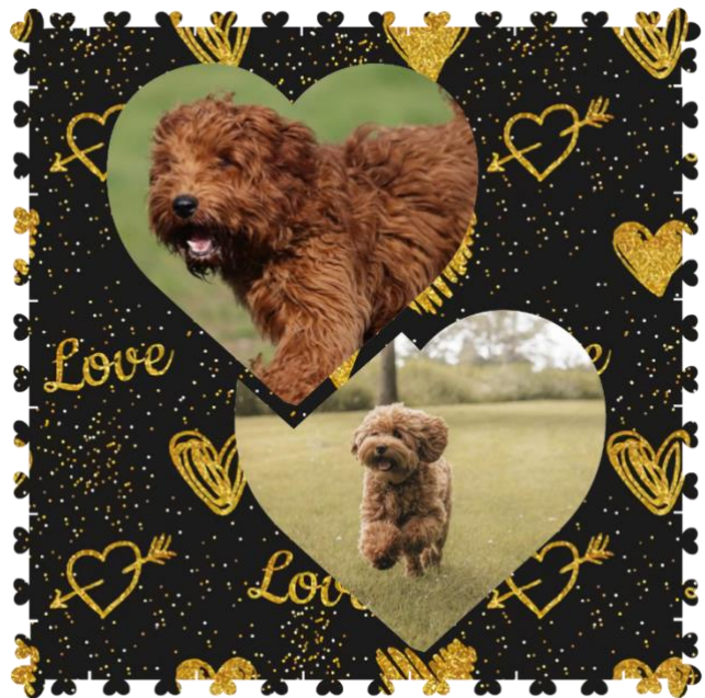
Zijn we geen knap stel?

We moeten bijna 2 uur rijden, maar dan eindelijk is hij daar. Knappe lieve Thuurke. Thuurke vind je denk net zo leuk als dat wij je altijd vinden, want in een no time is de dekking daar. Jullie staan nog 20 a 25 minuten aan elkaar gekoppeld. En dan vertrekken we weer richting huis.