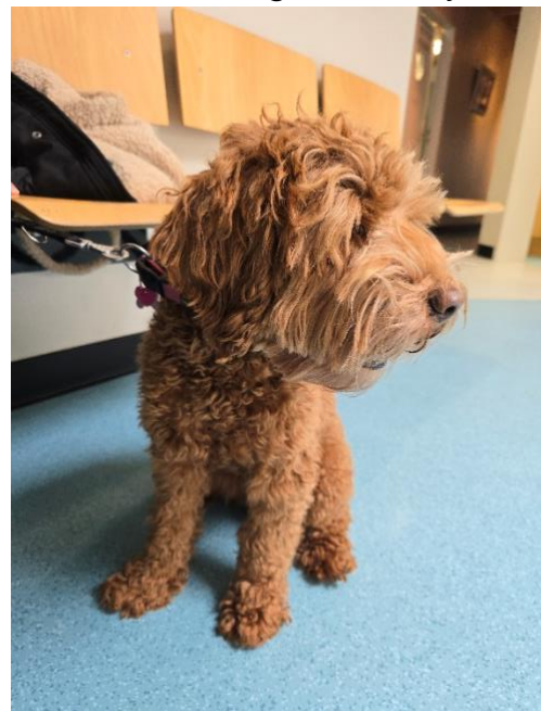
Samen wachten op de dierenarts.

Het word bijna een gewoonte, ons ritje samen naar de dierenarts. Wat ben je toch een lieverd. Onderweg geniet je van de knuffels onder je kin. We worden vandaag na het prikken snel gebeld. Je bent aan het stijgen, je staat nu op 2.65. Woensdag mogen we weer langskomen.