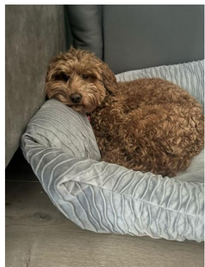
Heerlijk relaxen in je mandje