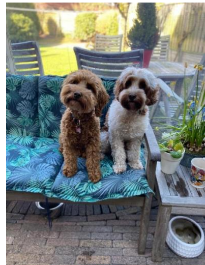
Wat zijn jullie leuk samen 😊